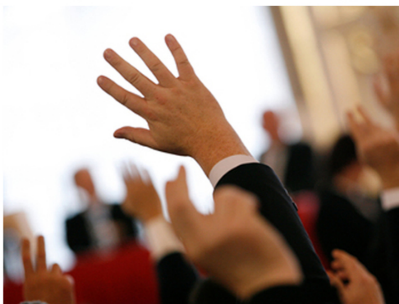
HLASUJI, HLASUJEŠ, HLASUJÍ

„Jsem tak říkajíc v němém úžasu, když sleduji, co všechno si krajská koalice je morálně schopna odhlasovat. Například motokrosový klub JAC Racing (najdete on-lina na www.jac-frydlant.cz) dostal hnedle půl milionu korun na sportovní akce, pořízení movitého majetku uvedeného jako motorky a náhradní díly. Snad chybou při kopírování řádků ten samý motokrosový klub z toho samého dělení medvěda obdržel pak dalších půl milionu korun na sportovní akce. Jeden milion korun tak šel motokrosovému klubu, který sám žádné akce evidentně nepořádá a podle přehledu na jejich vlastních webových stránkách se ani