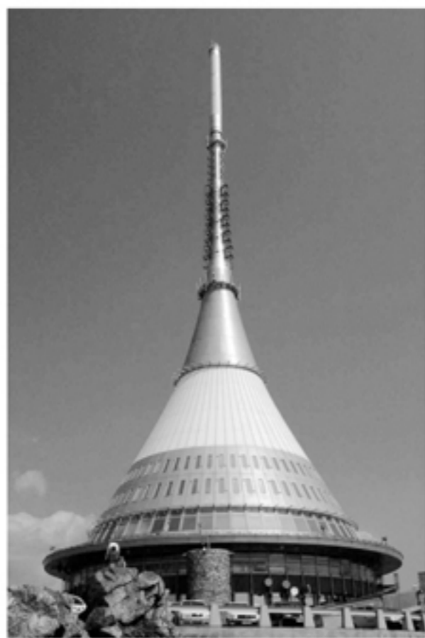
HORSKÝ HOTEL JEŠTĚD