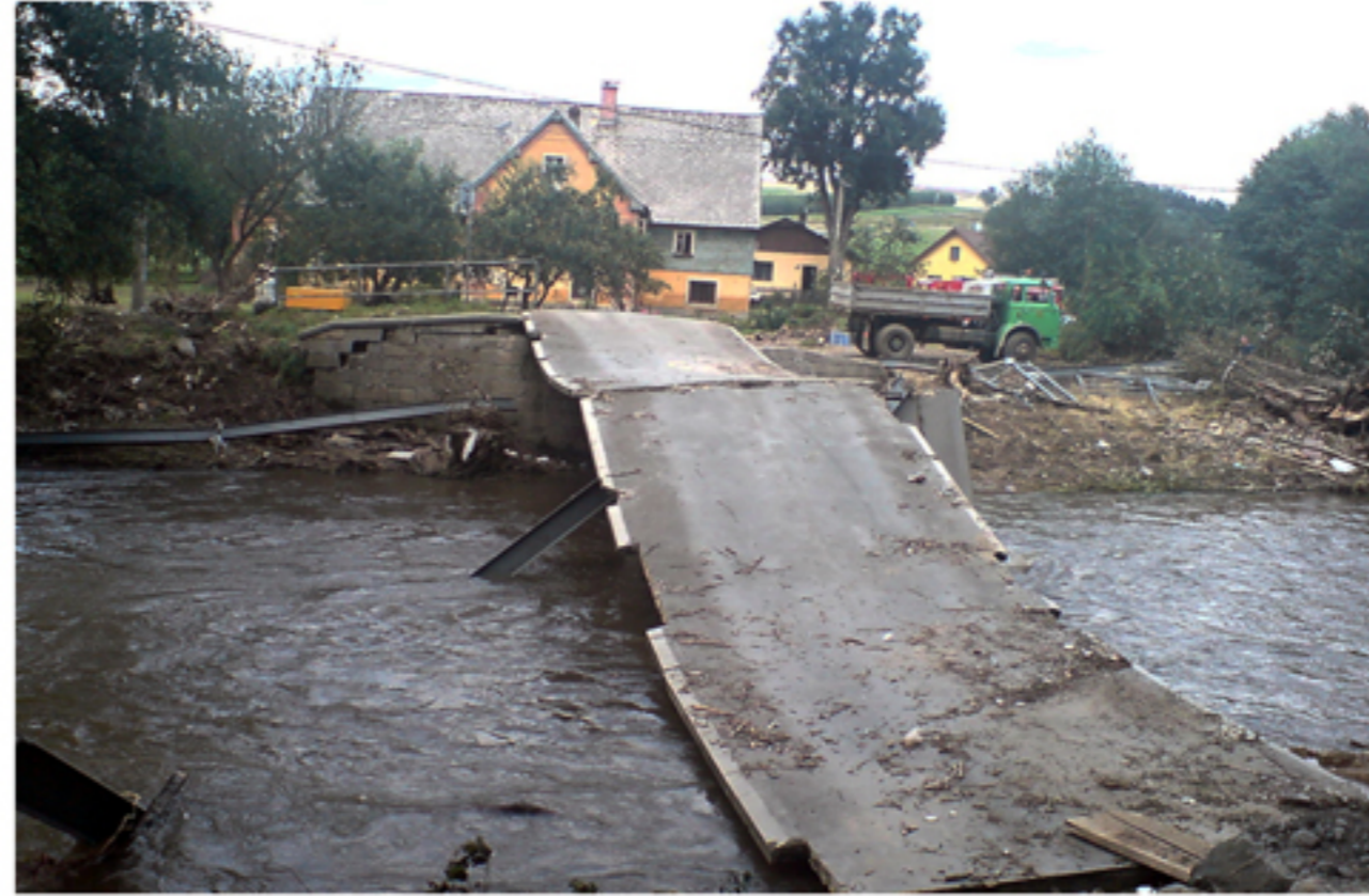
LOŇSKÁ POVODEŇ V CHRSTAVĚ ZASÁHLA VELMI KRUTĚ DO ŽIVOTA TISÍCŮ MÍSTNÍCH LIDÍ. PO ŽIVELNÉ POHROMĚ ZBYL KONEČNÝ ÚČET PŘÍBLIŽNĚ 1,5 MILIARDY KORUN. MĚSTO I LIDÉ SE S NÁSLEDKY BUDOU VYROVNÁVAT JEŠTĚ NĚKOLIK LET.

Už během průběhu první vlny začaly chodit první informa-