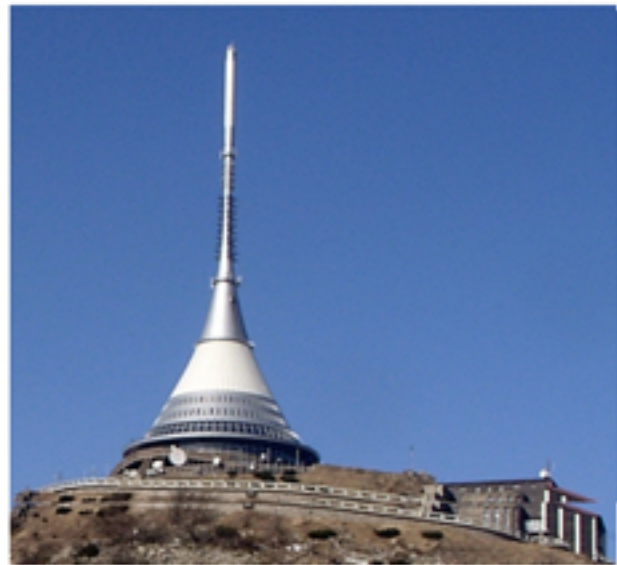
HOTEL JEŠTĚD

Liberec / Horský hotel Ještěd je přirozeným a nejznámějším symbolem Libereckého kraje. K památce navržené do seznamu UNESCO se kraj ale nemá.